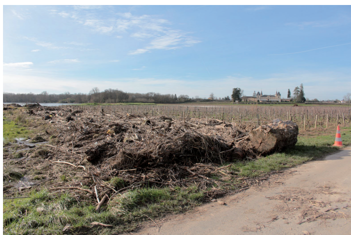
Les déchets laissés par la crue ont souvent endommagé des parcelles de vignes et de maïs (Château Millet).