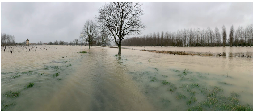
Le chemin du Port... à peine visible.