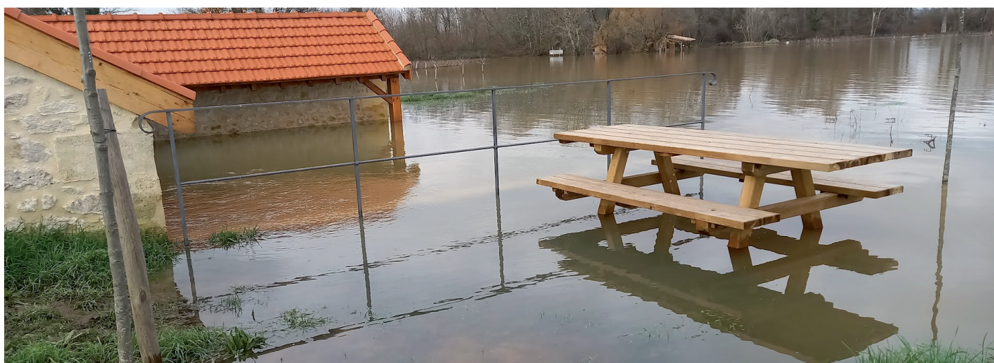
Le lavoir Daubaillan n'a pas été épargné, un gros travail de nettoyage en perspective, au loin le jardin des Radicelles... (Photo F.Turon).