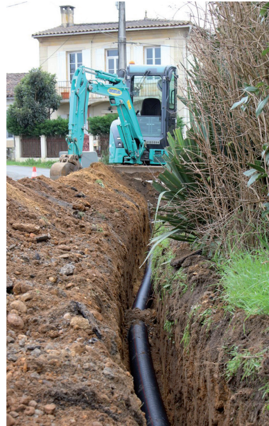
Passage rue Gueydon

La mise en ligne de ce nouveau réseau est prévue fin du 1er semestre