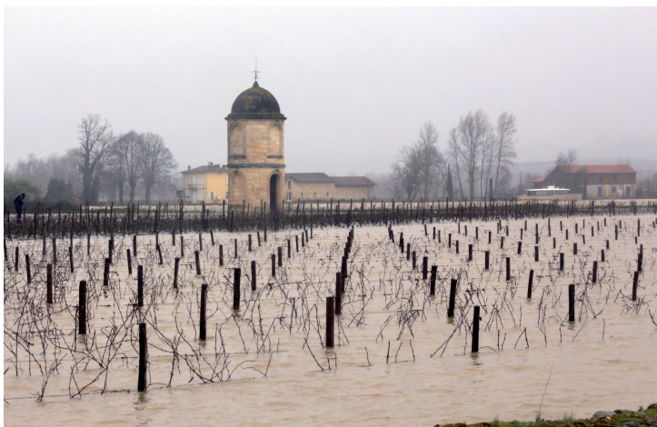
Les vignes et les peupliers inondés du château de Portets.