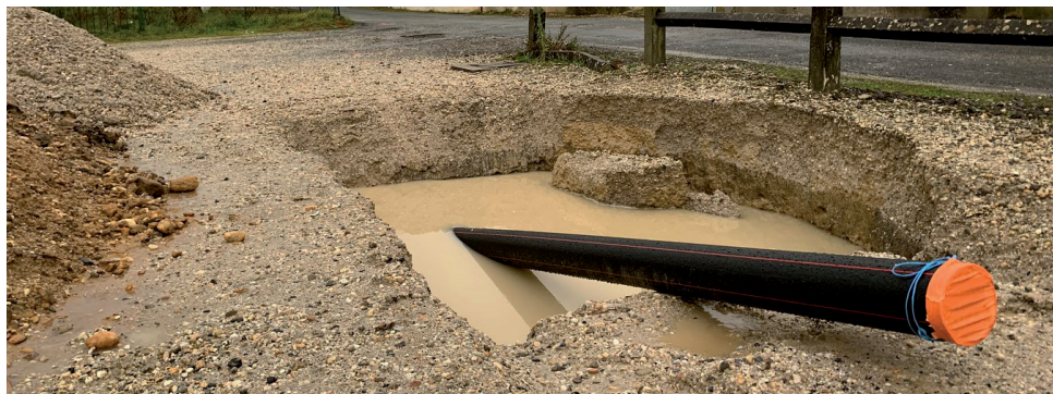
Traversée de la RD1113 en souterrain