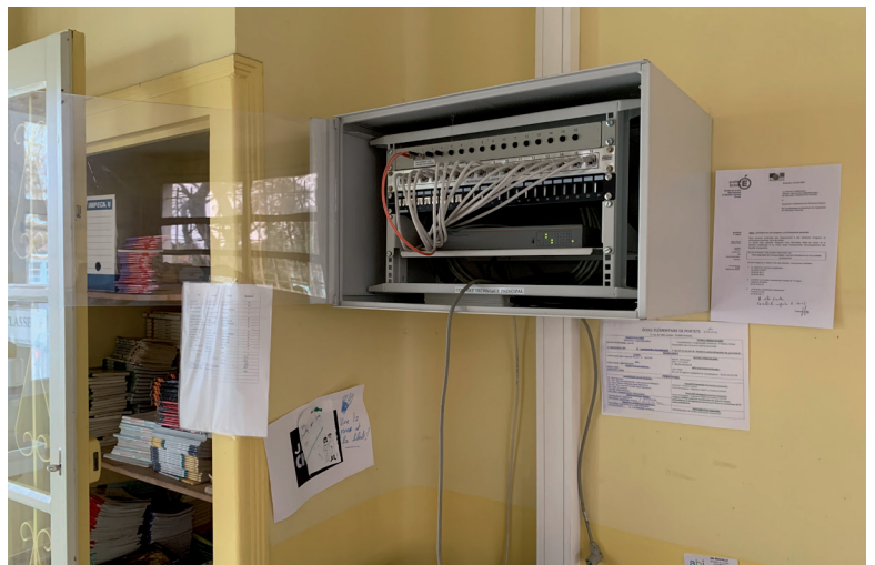
Un tableau vétuste refait à neuf

Le système de connexion internet de l'école élémentaire a été entièrement remis à neuf. Plus vraiment performant et inadapté aux enjeux d'une école moderne, le réseau internet méritait d'être globalement repensé. Après un diagnostic sans appel réalisé par Gironde Numérique, la municipalité a pris la décision de revoir la totalité de la distribution numérique dans toutes les classes. Cet aménagement essentiel permet de répondre à la demande légitime des enseignants autour d'une pédagogie de plus en plus numérique. Il est important que les enfants entrant au collège ne soient pas déstabilisés par des nouveaux outils utilisés en 6 ème . Maintenant que la connexion est fiable et bien distribuée, une classe informatique sera installée et les tableaux numériques remplaceront progressivement les tableaux blancs. Il est loin le temps de la craie et du plaisir de laver le tableau en fin de journée, une autre époque certes mais le plaisir d'apprendre est toujours là !