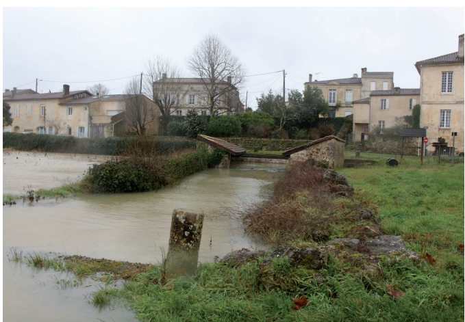
Le lavoir du port sous les eaux.